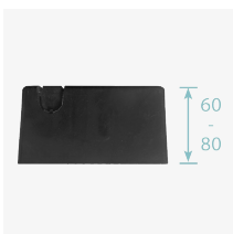
Cajetín empotrar incluido