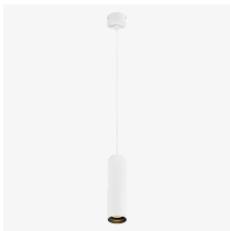
Disponible en suspensión