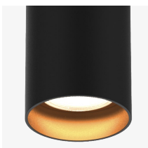
Cuerpo negro y reflector oro