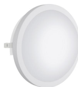
Far Round Led