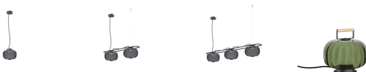
Krista D240x1 Krista D240x2 Krista D240x3 Krista T Corte de fase C Corte de fase C Corte de fase C D240x1