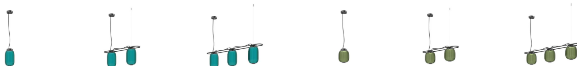
Krista D163x1 Krista D163x2 Krista D163x3 Krista D183 10W Krista D183x2 10W Krista D183x3 10W