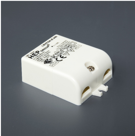
DRIVER 1 - 3W 350mA DC3 - 9V