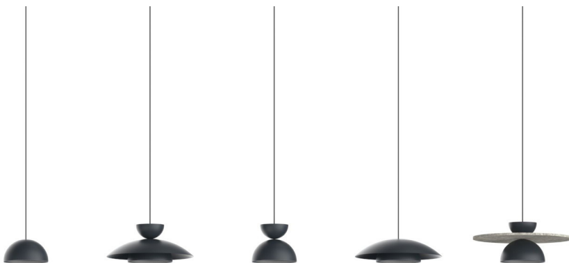
Tires Model 1 31310-