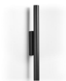
Tania W micro