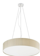
Vorada L C