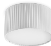
Vorada S N