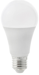
Bombilla E27 A60 PC 9W 2700K 820 Lm