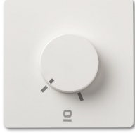
Controlador pared rotativo blanco aplique RF 6 velocidades