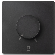
Controlador pared rotativo negro aplique RF 6 velocidades