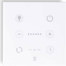
Controlador de pared blanco para ventilador DC con luz regulable