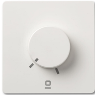
Controlador pared rotativo blanco aplique RF 6 velocidades